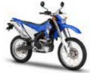
WR250R – Racing Blue (DPBSE)