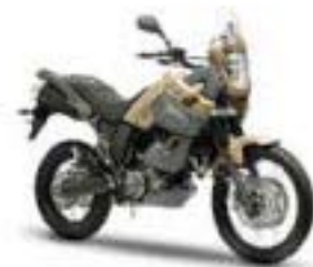
XT660Z Ténéré – Desert Khaki (YNS5)