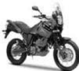
XT660Z Ténéré – Midnight Black (SMX)