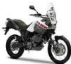
XT660Z Ténéré – Competition White (BWC1)