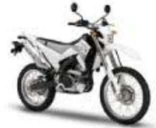
WR250R – Sports White (PWS1) *