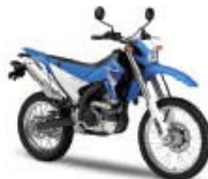
WR250R – Racing Blue (DPBSE)