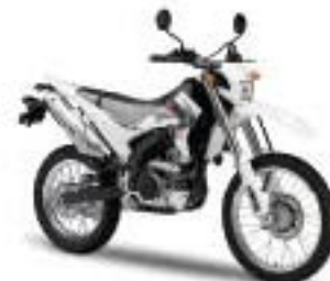
WR250R – Sports White (PWS1)