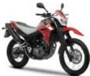
XT660R – Sunset Red (VYR1)