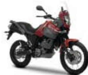
XT660Z Ténéré – Mystique Red (DRMU)