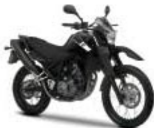
XT660R – Yamaha Black (YB)