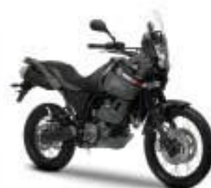
XT660Z Ténéré – Midnight Black (SMX)