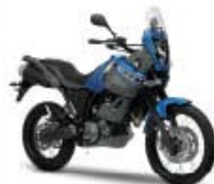
XT660Z Ténéré – Power Blue (BMC)