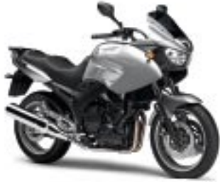
TDM900A – Silver Tech (S3)