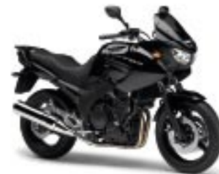
TDM900A – Midnight Black (SMX)