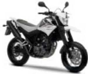
XT660X – Sports White (PWS1)