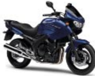
TDM900A – Thunder Blue (DPBMX)