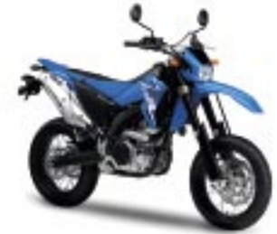
WR250X – Racing Blue (DPBSE)