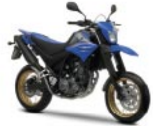
XT660X – Racing Blue (DPBSE)