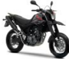
XT660X – Yamaha Black (YB)