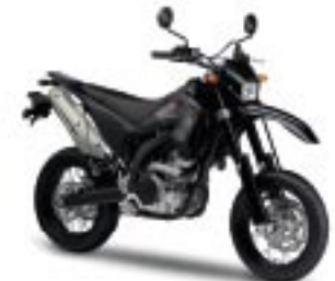
WR250X – Yamaha Black (YB)