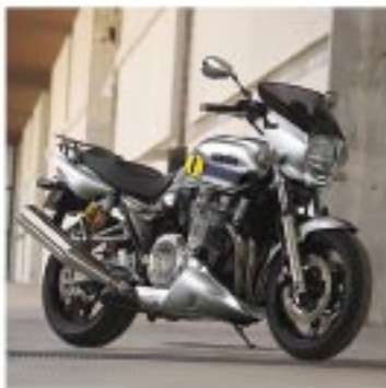
XJR1300 mit Yamaha Original-Zubehör.

Yamaha Zubehör und Bekleidung im Street-Styling.