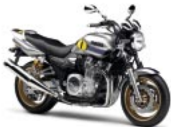
XJR1300 – Silver Tech (S3)