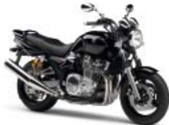
XJR1300 – Midnight Black (SMX)