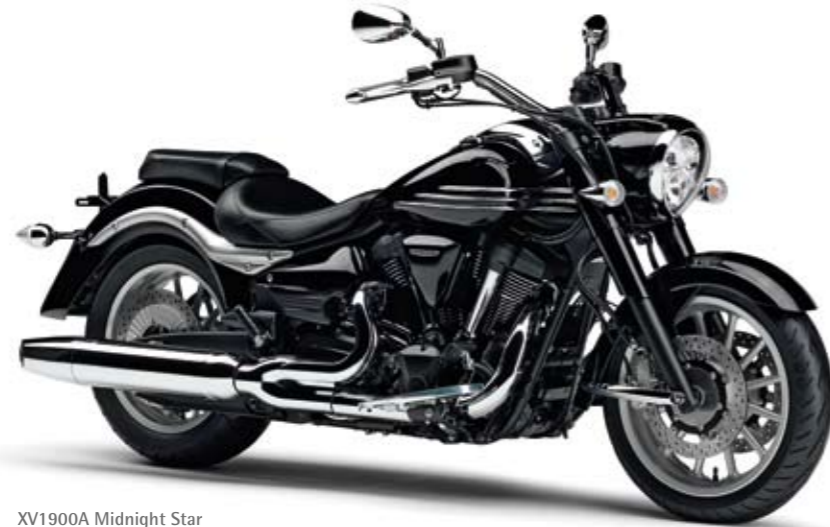
XV1900A Midnight Star Midnight Black (SMX)