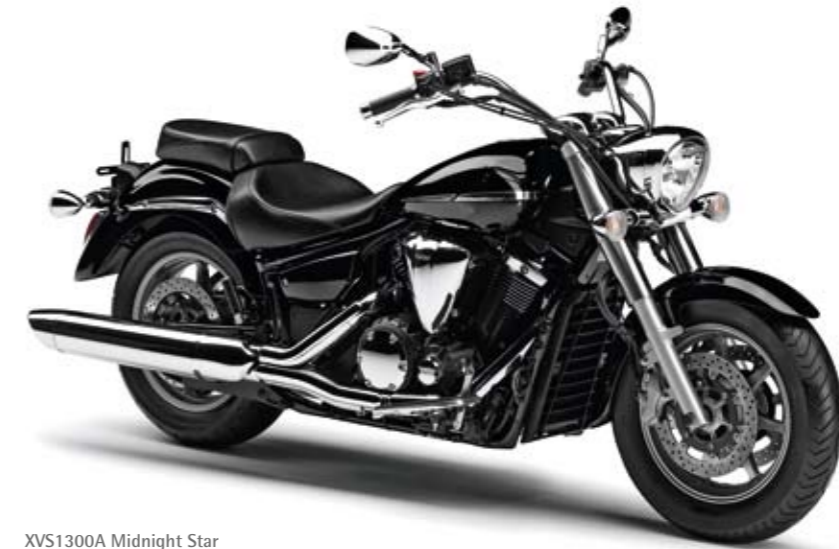
XVS1300A Midnight Star Midnight Black (SMX)