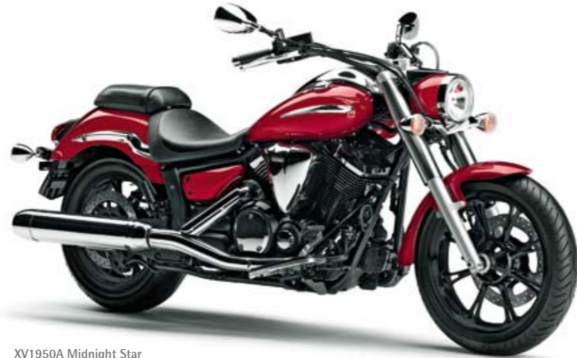
XV1950A Midnight Star Lava Red (DMRK)