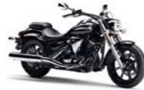
XV1950A Midnight Star Midnight Black (SMX)