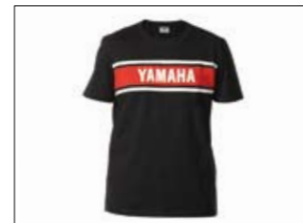
Classic T-Shirt, schwarz