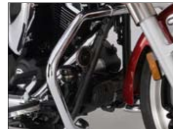
Großer Motorschutzbügel XVS950A Midnight Star