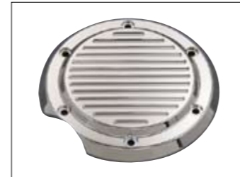
Lichtmaschinenabdeckung XVS1300A Midnight Star