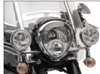
Zusatzscheinwerfer XV1900A Midnight Star (nicht homologiert)