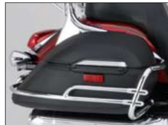
Leder- Hartschalenkoffer & Koffer – Reling XVS1300A Midnight Star