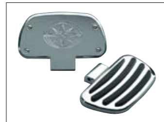
Billet Beifahrer-Fußplatten XVS950A Midnight Star