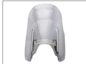
Windschild XV1900A Midnight Star

Mit einem Cruiser von Yamaha sind Sie stets gut unterwegs. Trotzdem gibt es immer wieder Dinge im Leben, die man verbessern oder einfach nur ändern möchte. Hier kommt das umfangreiche Programm an aufpreispflichtigen Extras ins Spiel – für Sie und Ihre Midnight Star. Das Angebot reicht von handgefertigten Chromteilen über klassische Satteltaschen aus Leder bis hin zu moderner Fahrer- und Freizeitbekleidung. Mehr Informationen dazu gibt's beim YamahaHändler in Ihrer Nähe oder im Internet unter www.yamaha-motor.de