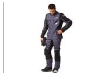
Adventure Fahrerjacke und Hose