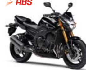
FZ8 ABS Midnight Black (SMX)