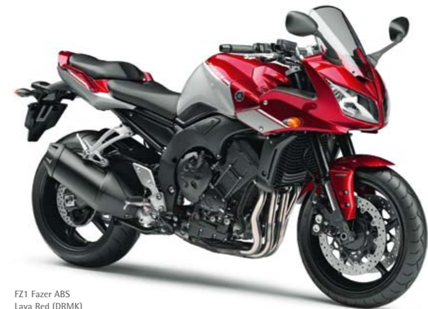
FZ1 Fazer ABS Lava Red (DRMK)