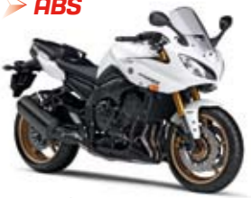
Fazer8 ABS Competition White (BWC1)