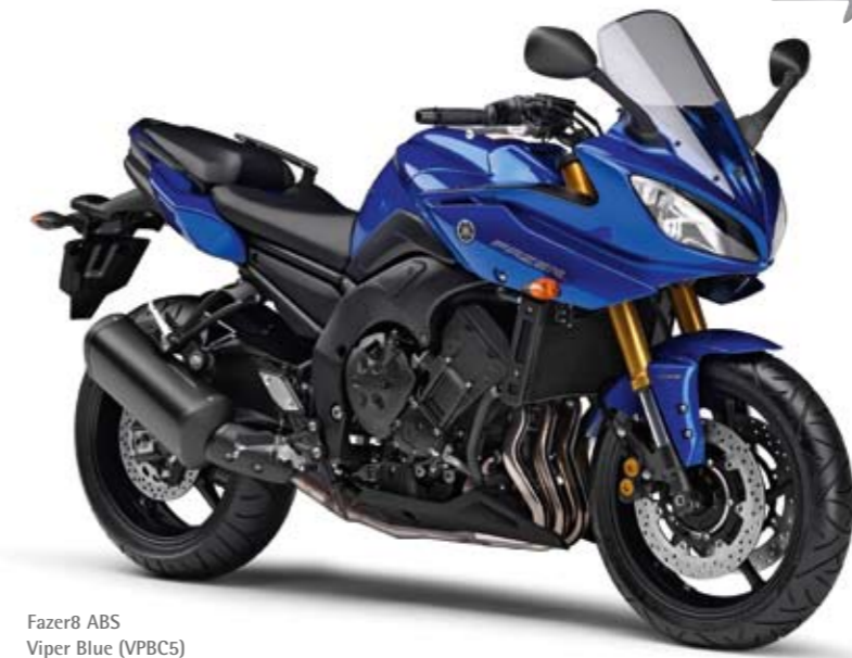
Fazer8 ABS Viper Blue (VPBC5)