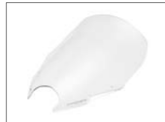
Hohe Windschutzscheibe Fazer8