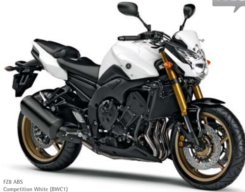
FZ8 ABS Competition White (BWC1)