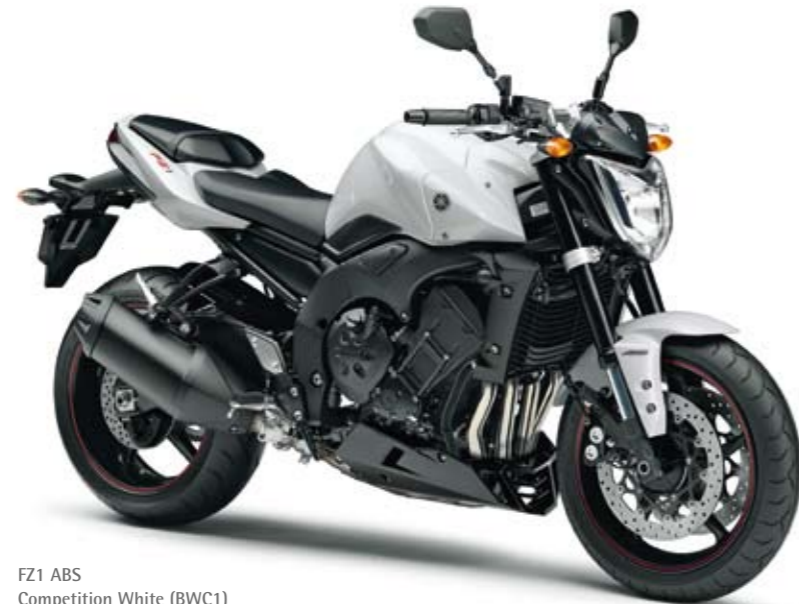
FZ1 ABS Competition White (BWC1)