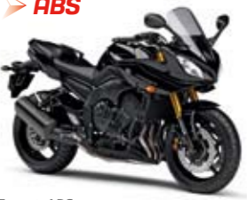
Fazer8 ABS Midnight Black (SMX)