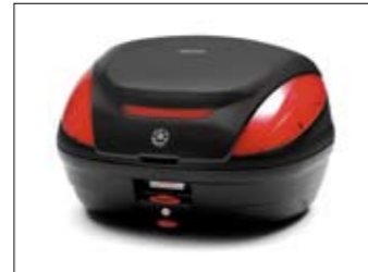
46 Liter Topcase