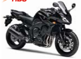
FZ1 Fazer ABS Midnight Black (SMX)