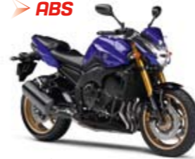
FZ8 ABS Yamaha Blue (DPBMC)