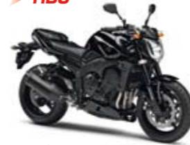
FZ1 ABS Midnight Black (SMX)