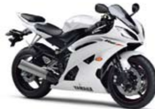
YZF-R6 Competition White (BWC1)