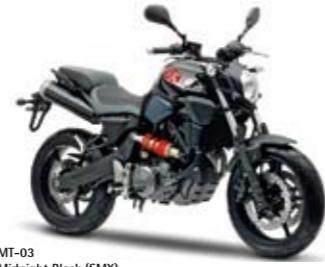
MT-03 Midnight Black (SMX)