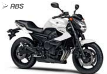
XJ6 ABS Competition White (BWC1)