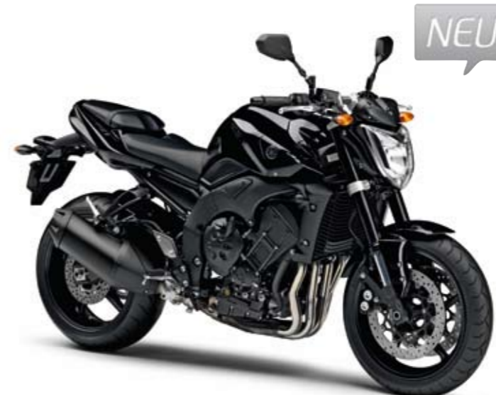
FZ1 Midnight Black (SMX)