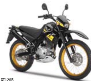
XT125R Yamaha Black (MASB)