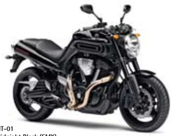
MT-01 Midnight Black (SMX)