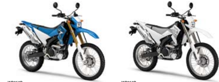
WR250R Racing Blue (DPBSE)