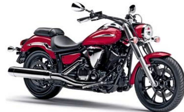
XVS950A Midnight Star Lava Red (DRMK)