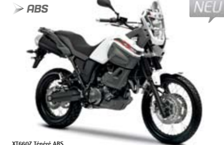
XT660Z Ténéré ABS Competition White (BWC1)