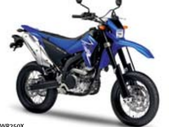
WR250X Racing Blue (DPBSE)