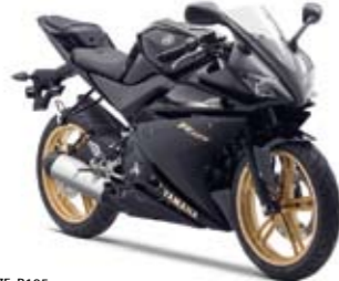
YZF-R125 Power Black (MBL2)