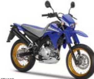
XT125X Racing Blue (MAB)