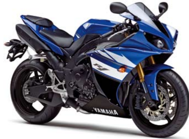
YZF-R1 Yamaha Blue (DPBMC)