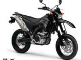
WR250X Yamaha Black (YB)