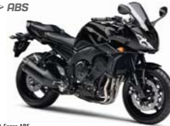
FZ1 Fazer ABS Midnight Black (SMX)