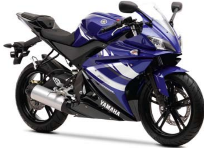
YZF-R125 Yamaha Blue (DPBM13)