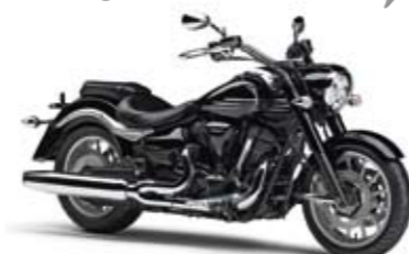
XV1900A Midnight Star Midnight Black (SMX)