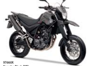
XT660X Yamaha Black (YB)