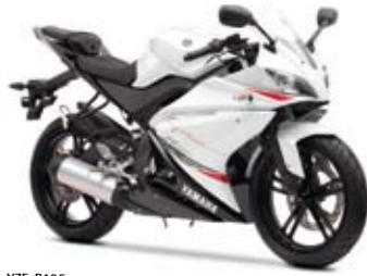
YZF-R125 Competition White (BWC1)