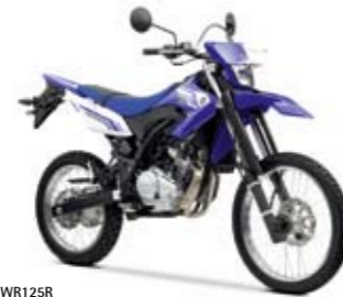
WR125R Racing Blue (DPB5E)