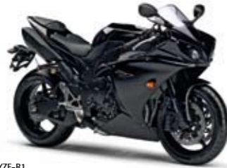
YZF-R1 Midnight Black (SMX)