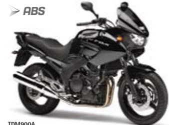
TDM900A Midnight Black (SMX)