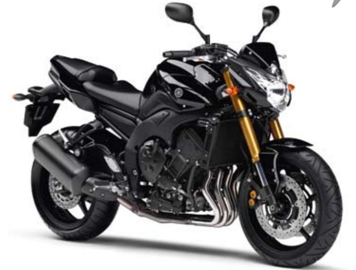
FZ8 Midnight Black (SMX)