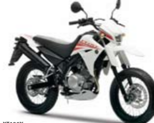
XT125X White Flash (MAW)