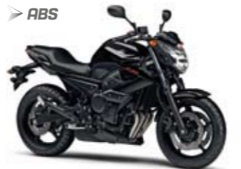
XJ6 ABS Midnight Black (SMX)