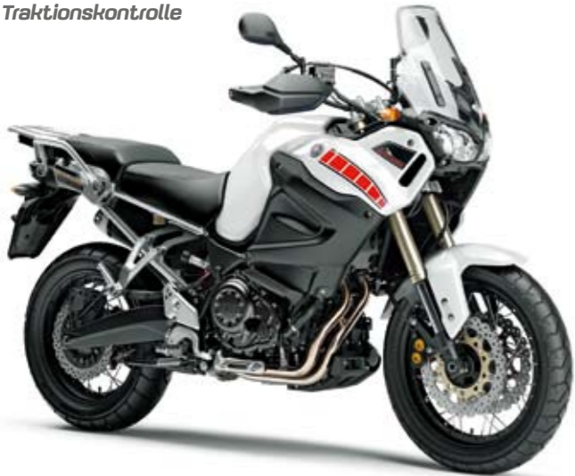
XT1200Z Super Ténéré ABS Competition White (BWC1)