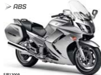
FJR1300A Silver Tech (S3)