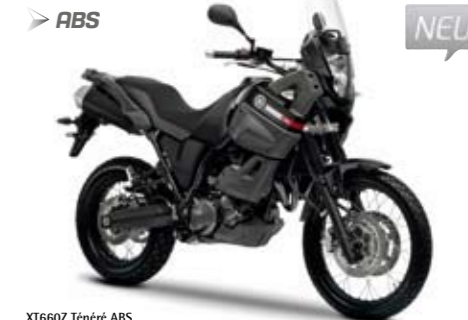
XT660Z Ténéré ABS Midnight Black (SMX)