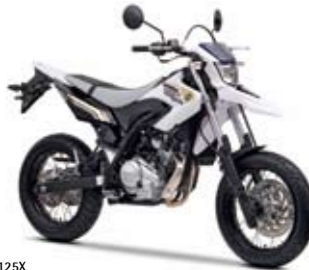
WR125X Sports White (PWS1)