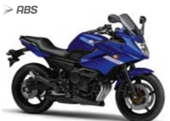
XJ6 Diversion ABS Viper Blue (VPBCs)