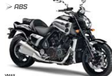
VMAX Solar Black (SMM)