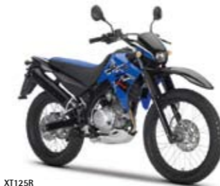
XT125R Racing Blue (MAB)