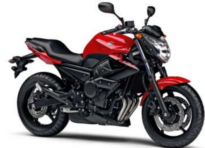
XJ6 ABS Racing Red (VRC1)