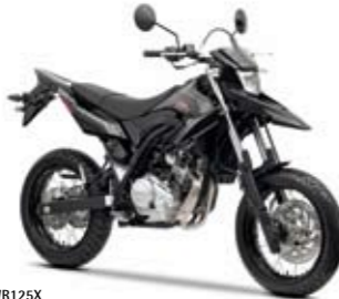
WR125X Yamaha Black (YB)