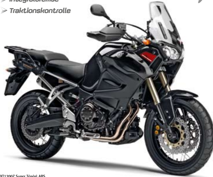
XT1200Z Super Ténéré ABS Midnight Black (SMX)