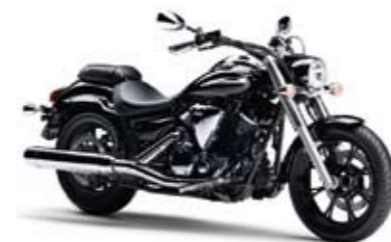
XVS950A Midnight Star Midnight Black (SMX)