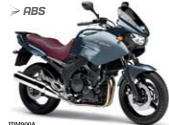
TDM900A Gun Metallic (MDS)