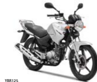
YBR125 Light Grey Metallic (LGM3)