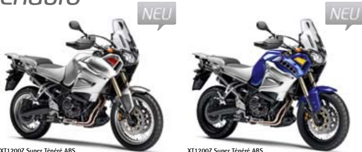
XT1200Z Super Ténéré ABS Silver Tech (S3)