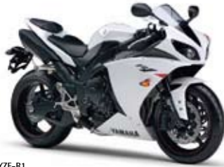
YZF-R1 Competition White (BWC1)