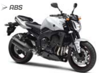
FZ1 ABS Competition White (BWC1)