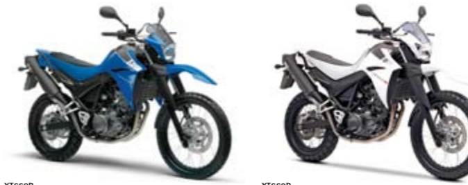
XT660R Racing Blue (DPBSE)