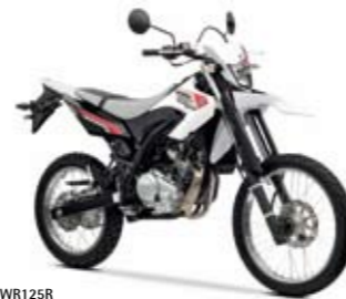
WR125R Sports White (PWS1)