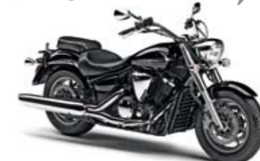
XVS1300A Midnight Star Midnight Black (SMX)