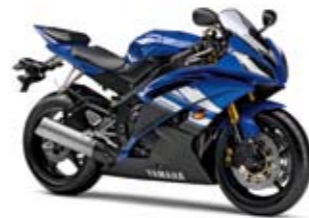
YZF-R6 Yamaha Blue (DPBMC)