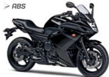
XJ6 Diversion F ABS Midnight Black (SMX)