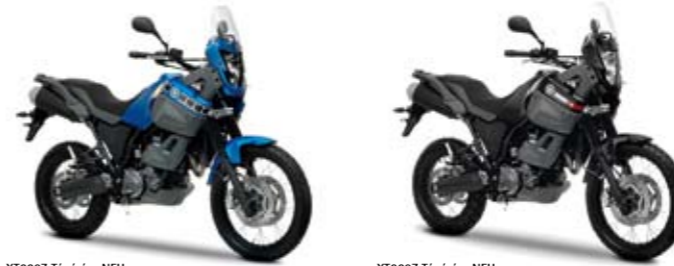
XT660Z Ténéré - NEU Power Blue (BMC)