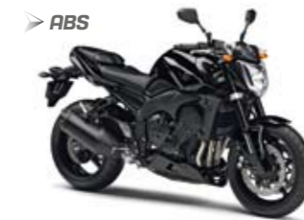
FZ1 ABS Midnight Black (SMX)