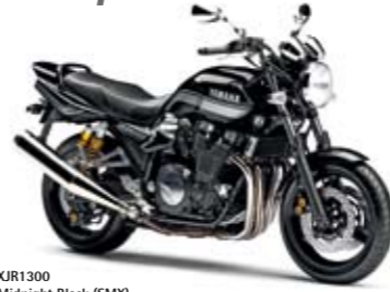
XJR1300 Midnight Black (SMX)