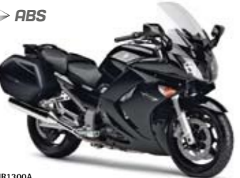
FJR1300A Midnight Black (SMX)