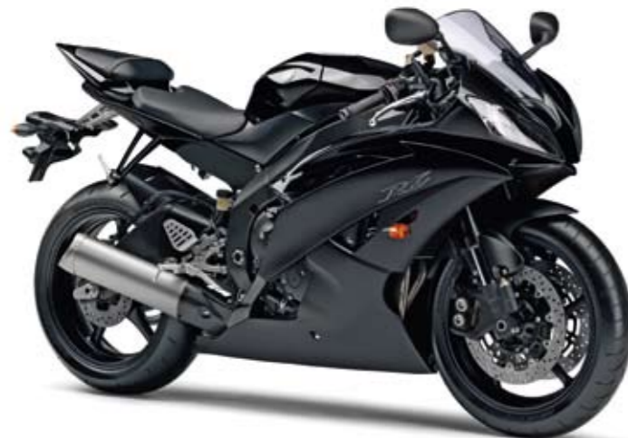
YZF-R6 Midnight Black (SMX)