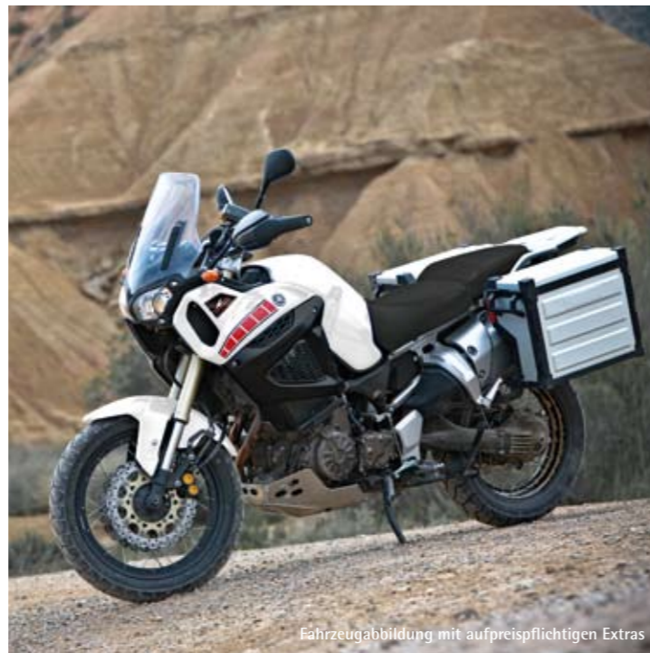
Fahrzeugabbildung mit aufpreispflichtigen Extras