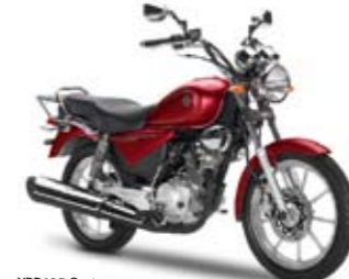
YBR125 Custom Red Spirit (VRC7)