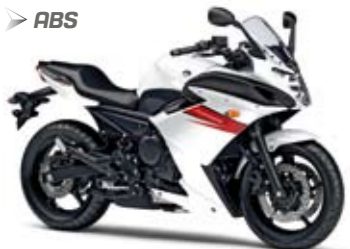
XJ6 Diversion F ABS Competition White (BWC1)