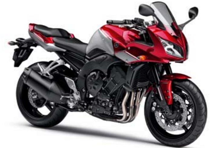
FZ1 Fazer ABS Lava Red (DRMK)