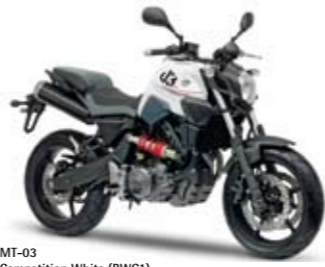
MT-03 Competition White (BWC1)