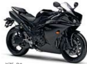
YZF-R1 Midnight Black (SMX)