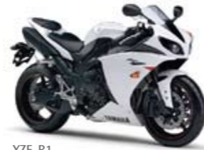
YZF-R1 Competition White (BWC1)