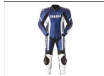
1teilige Lederkombi Speedblock - blau