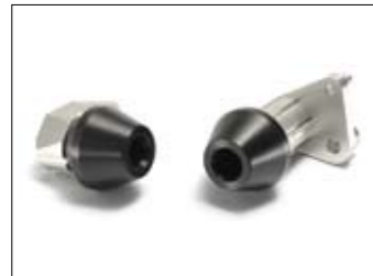
Sturzprotektoren - YZF-R6