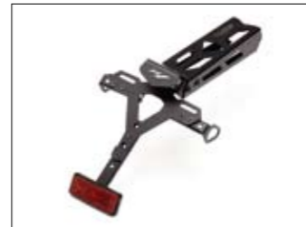
Kennzeichenhalter - YZF-R1