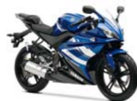
YZF-R125 Yamaha Blue (DPBMC)