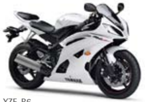
YZF-R6 Competition White (BWC1)