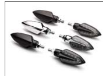
LED Blinker Set (Schwarz, Carbon-Look und Chrom)