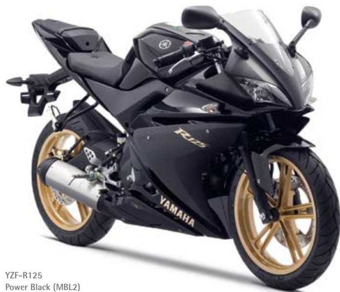
YZF-R125 Power Black (MBL2)