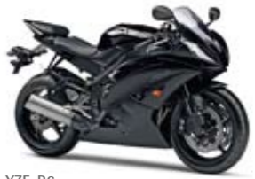
YZF-R6 Midnight Black (SMX)