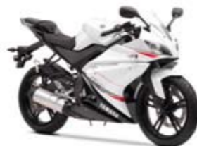
YZF-R125 Competition White (BWC1)