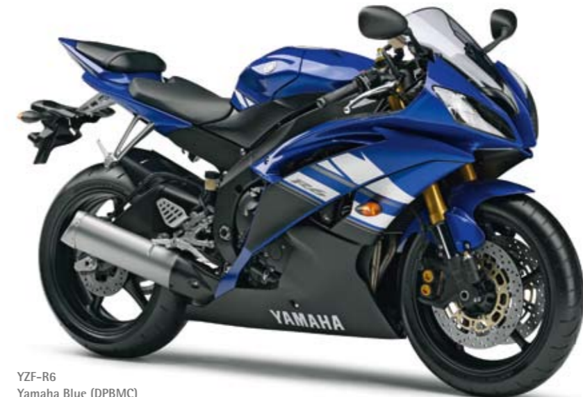
YZF-R6 Yamaha Blue (DPBMC)