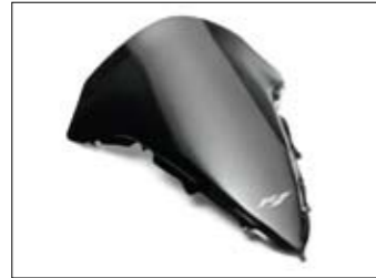
Getönte Verkleidungsscheibe Flip-up - YZF-R1

Neben funktionellen und modischen Zubehörprodukten bietet Yamaha eine Kollektion hochwertiger und innovativer Fahrerbekleidung an, die sich durch hohen Tragekomfort auszeichnet. Ein umfangreiches Angebot an Freizeitbekleidung ist ebenfalls Bestandteil des Yamaha Programms. Weitere Informationen finden Sie unter: http://www.yamaha-motor.de/accessories/