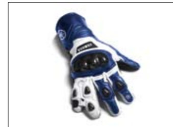
Speedblock Handschuhe - blau