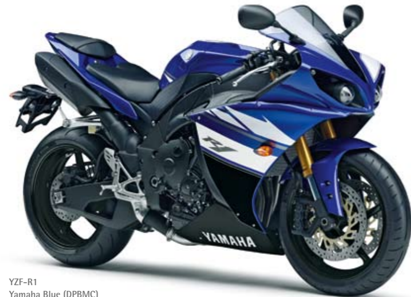
YZF-R1 Yamaha Blue (DPBMC)