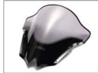
Getönte Verkleidungsscheibe Double Bubble - YZF-R6